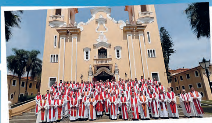
Retiro anual do clero reflete: "O Padre: Discípulo de Cristo" Confira na página 7