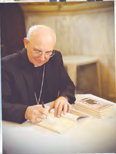
Um convite à caridade: o novo livro de Dom Pedro sobre São Vicente de Paulo Confira na página 4